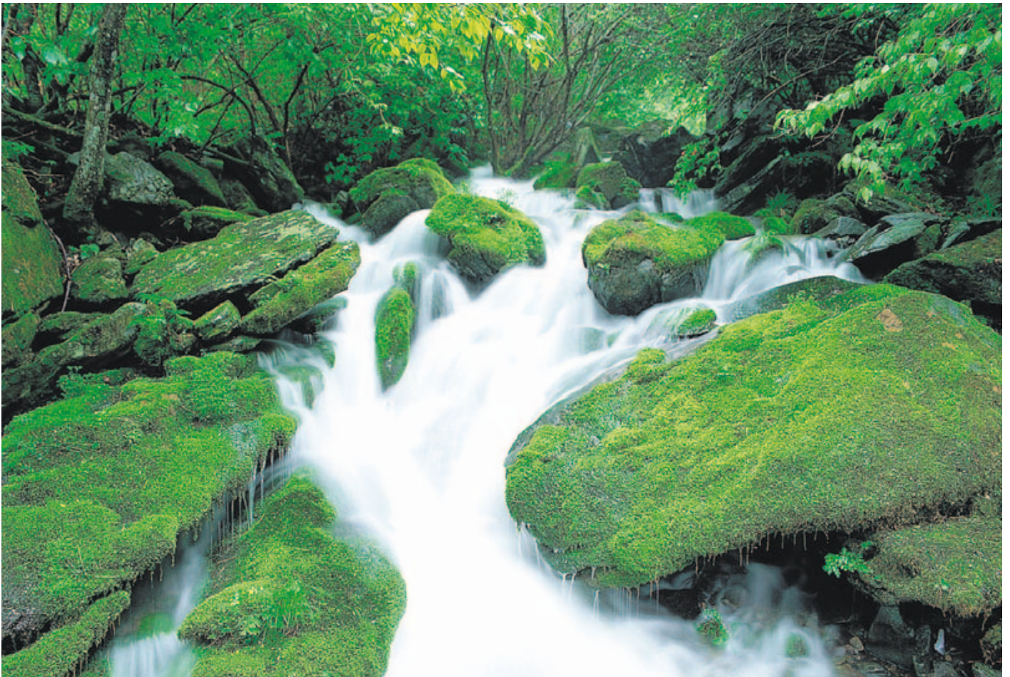
Frisch gebildete Ionen in der Luft verleihen ein ähnlich erfrischendes Gefühl wie das Body Detox® Elektrolyse Fussbad, das auch auf dem Prinzip der Ionisierung aufbaut.

Dieses einzigartige Gefühl verdanken wir der reinigenden Wirkung der tausendfach frisch gebildeten Ionen in der Luft. Das